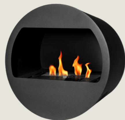
B2. Caminetto a bioetanolo