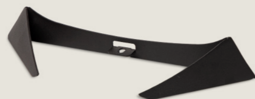
Supporto in metallo