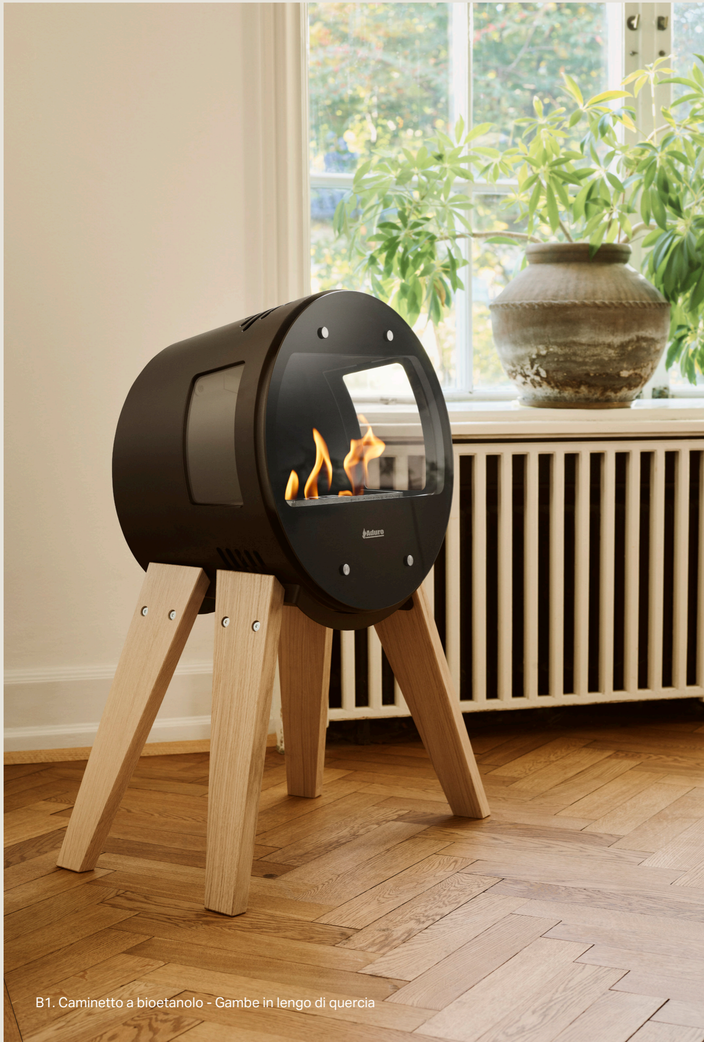
B1. Caminetto a bioetanolo - Gambe in lengo di quercia