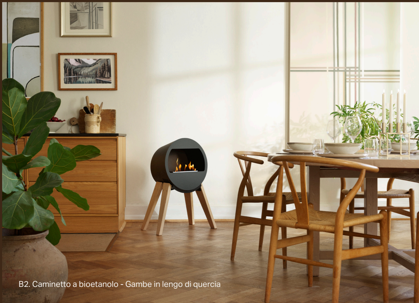
B2. Caminetto a bioetanolo - Gambe in lengo di quercia