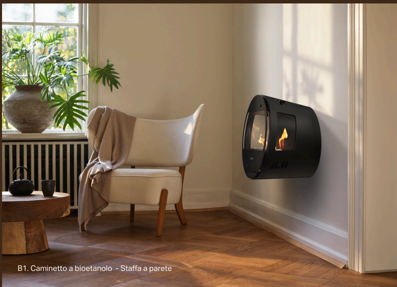
B1. Caminetto a bioetanolo - Staffa a parete